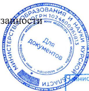
Н. А. Бастрикова

Временно исполняющий обязанности министра